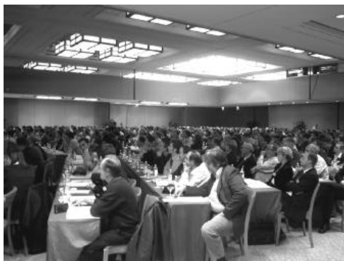
Les congressistes attentifs