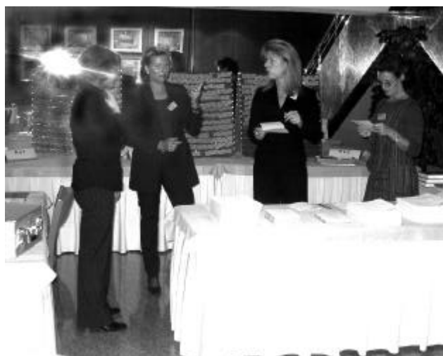
L'éblouissant comité d'accueil