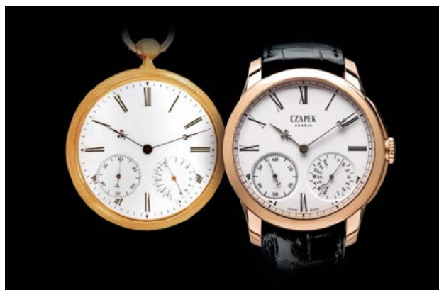
Fig. 1 : Montre de poche 3430 Czapek & Cie, env. 1850 et sa réinterprétation contemporaine, la Quai des Bergues 33bis.

En 2012, Harry Guhl, Xavier de Roquemaurel et Sébastien Follonier, rétablissent la société Czapek & Cie, désireux de faire revivre l'ancienne légende de François Czapek.