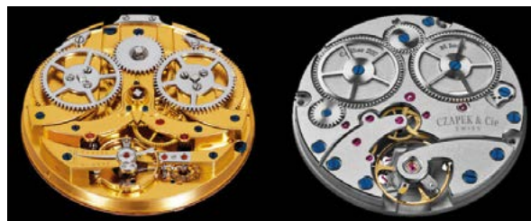
Fig. 2: Calibre Czapek de 1850 et calibre SXH1.

Dès le début, Czapek a été transparent quant à son choix d'utiliser l'établissage comme approche et de créer une «manufacture horizontale» composée des meilleurs partenaires régionaux helvétiques qui partagent la même vision que la maison genevoise. Depuis sa relance en 2015, elle a toujours été ouverte concernant ses fournisseurs de pièces (toujours appelés «partenaires», le mot «sous-traitant» étant banni) ou de mouvements complets.