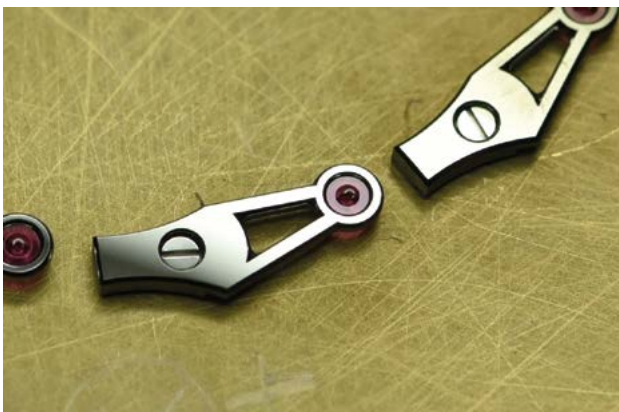
Fig. 7: Les ponts en maillechort sont texturés au laser, anglés, cerclés et rhodiés en « Black-Or ». Le pont central aux angles rentrants est poli miroir.

surface résultante peut apparaître noire sous un angle et blanche sous un autre. C'est, entre autres, la société Planiété à Bôle qui s'est chargée de cette exécution.