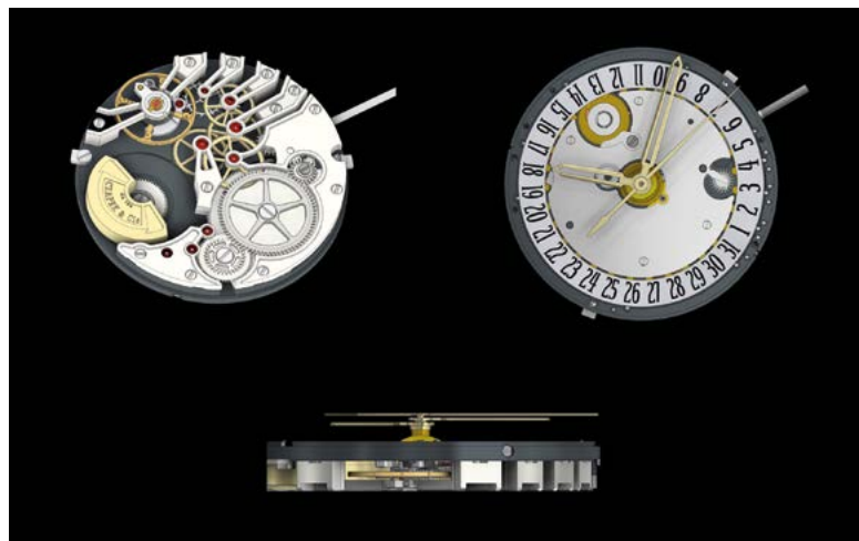
Fig. 4: Le micro-rotor est placé au centre pour permettre une vision dégagée du mécanisme et de son architecture.

« Personne ! » répondent designer et constructeur. C'est l'esprit de collaboration qui doit passer en premier. Si un choix est dicté par l'une des deux parties c'est l'échec qui s'approche. L'esprit de collaboration force les uns et les autres à sortir de leur zone de confort et à proposer des solutions innovantes. La création d'un calibre de base avec suffisamment de puissance pour en faire le tracteur de toutes les complications futures est un exercice qui a l'air simple sur le papier mais qui est assez périlleux... en particulier si, pour l'occasion, il passe les tests nécessaires pour avoir le droit de s'appeler « Chronomètre ». Il faut non seulement réussir l'examen mais aussi maintenir l'excellence chronométrique pendant des années... tout en ayant flirté avec la faisabilité pendant la conception. Ainsi le choix du