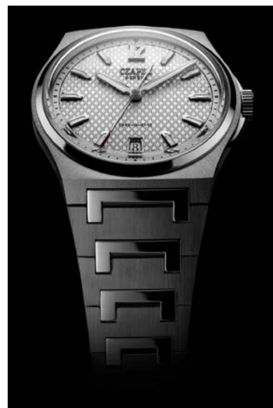
Fig. 8: Le modèle Passage de Drake Ice White.

Le mardi 26 mai 2020, seulement 18 mois après le début du projet SXH5, Czapek & Cie lance «Antarctique», son nouveau modèle motorisé par le calibre SXH5. Le lancement se fait par le moyen d'une souscription de 99 pièces pendant un délai de 45 jours. En raison de la pandémie, les lancements se sont faits rares, et ce jour-là, par chance (il en faut aussi), aucun autre horloger ne fait de lancement. Il y a un véritable boulevard médiatique libre pour la marque. En 17 jours, la souscription est close, les 99 pièces sont commandées. À celles-ci s'ajoutent deux petites séries limitées de 10 pièces avec cadrans éthérés vernis à la main... en l'espace de quelques semaines, la jeune société passe à travers la plus grande crise horlogère des 50 dernières années pour réaliser son meilleur chiffre d'affaires grâce à une approche directe et transparente avec tous ses partenaires, des artisans de nos montagnes aux consommateurs à l'autre bout du monde. ■