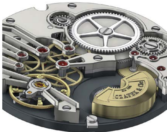
Fig. 5: Le Calibre SXH5 est équipé d'un balancier à inertie variable.

Au centre du Calibre SXH5 se trouve un pont supportant la troisième roue. Ce pont comprend six angles rentrants, un élément «signature» de la haute horlogerie, témoin d'une finition artisanale et minutieuse. De plus, ce pont est embelli par un polissage noir, également appelé polissage miroir réalisé sur une plaque recouverte de pâte de diamant. La