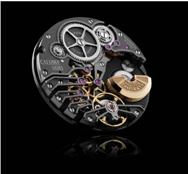
Fig. 3: Le calibre SHX5.01 automatique est le premier à avoir été entièrement conçu à l'interne.